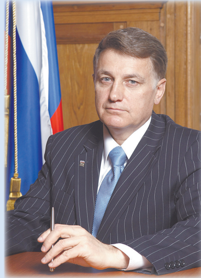
В.С. Макаров Председатель Законодательного собрания Санкт-Петербурга, секретарь Санкт-Петербургского регионального отделения партии «Единая Россия»