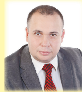
К.А. Чебыкин Депутат Законодательного собрания Санкт-Петербурга от фракции «Единая Россия»

Желаю вам крепких нервов, добрых и умных учеников!